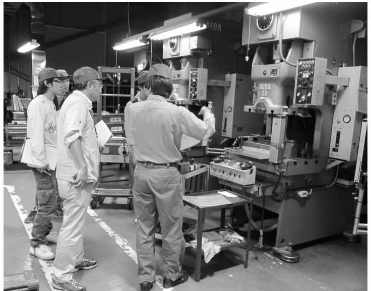
▲昨年東京労働安全衛生学校から(2010/9/24)

プログラムは職場巡回から始まります。職場を見学し、アクション・チェックリストを使って作業場の良い点、改善点をチェックします。どんな現場でも知恵と工夫があり、そこに着目します。